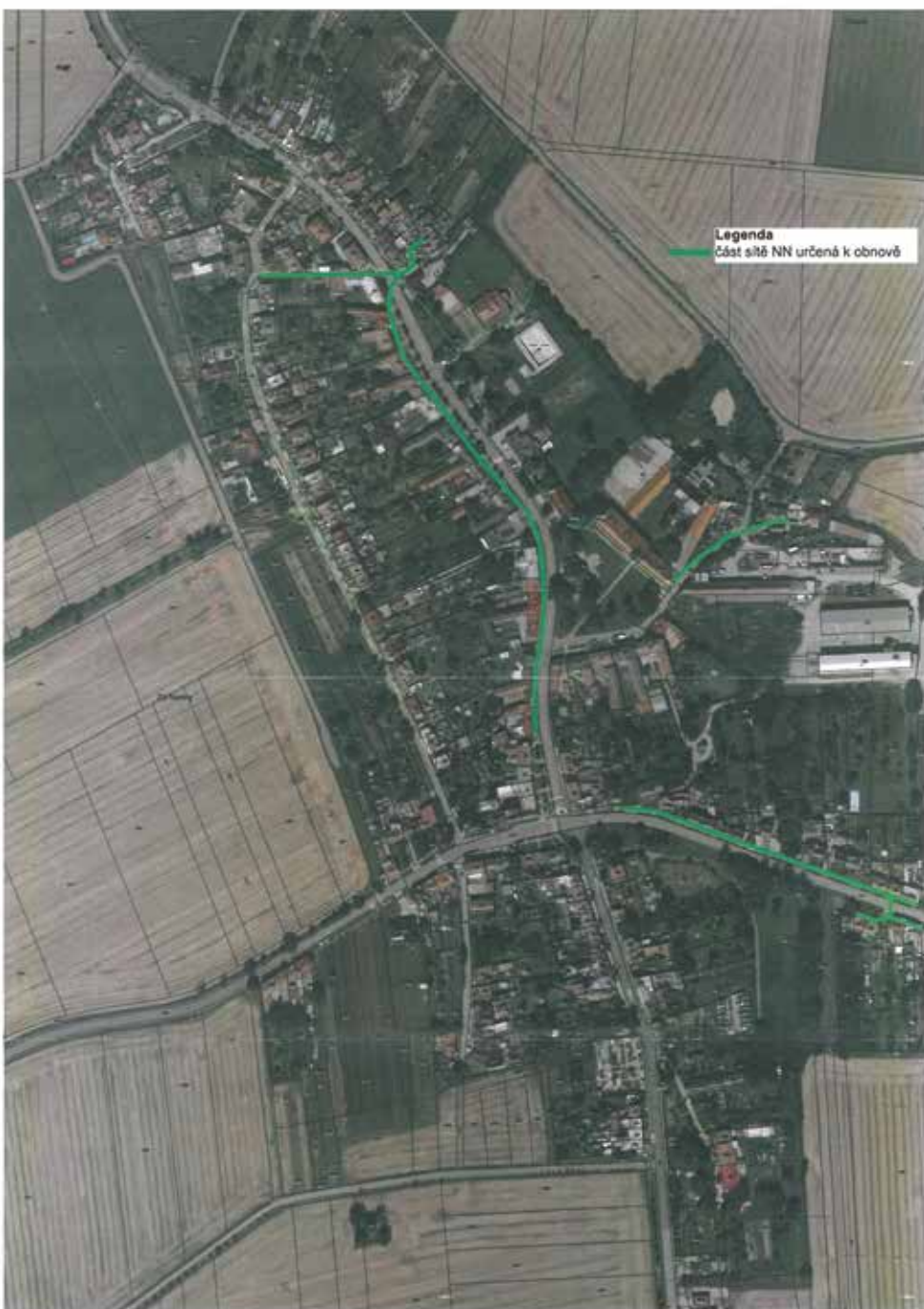
Stavba: 1040013132 Mořice, sm. Vrchoslavice, měnčice, kabel NN Název: Přehledová mapa